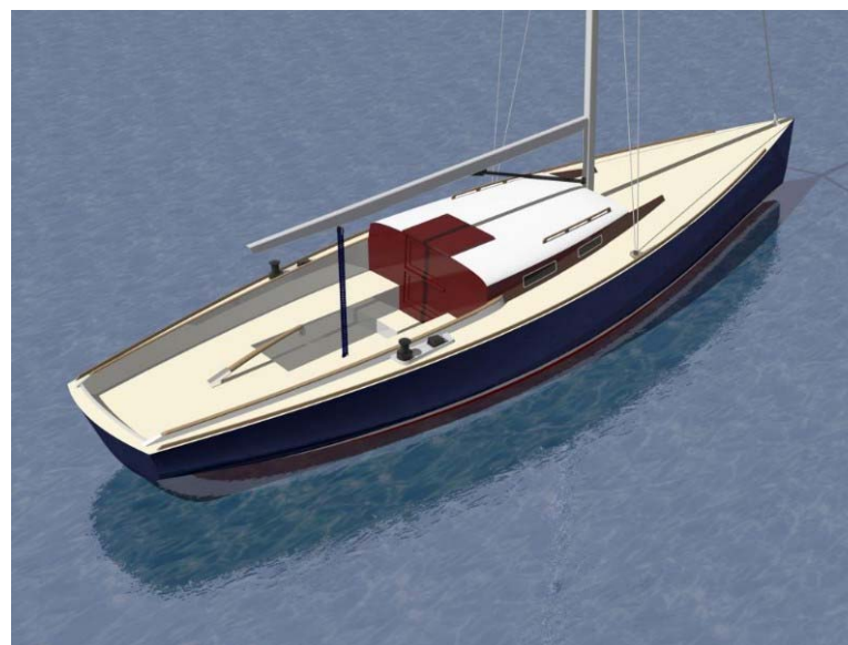
Biehl 8.8 har påhængsmotoren (elektrisk eller diesel) i en overdækket brønd lige under rorpinden. Læg mærke til det forlængede cockpit.

Bådens mål er som følger: LOA: 8,77m, bredde 2,28m, vægt 1,6 ton hvoraf de 550 kg ligger i torpeden for enden af kølen. Storsejlet er omkring 20 kvm i hvad konstruktøren kalder "coast and comfort", mens det bliver fire kvm større med America's Cup-top. Gennakeren er på 45 kvm.