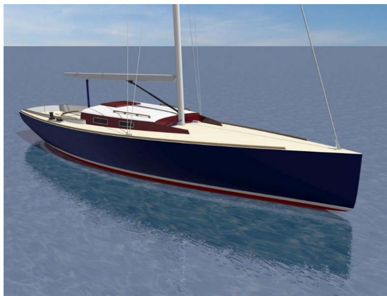
Biehl 8.8 en ny båd, der ligner noget man kender.